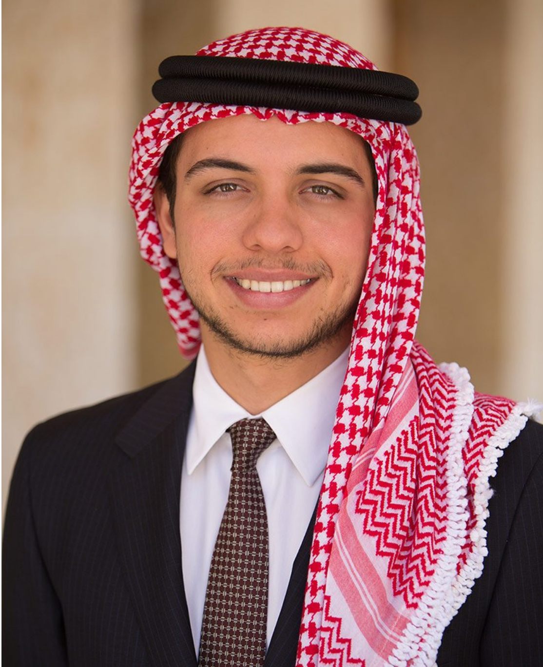
حضرة صاحب السمو الملكي