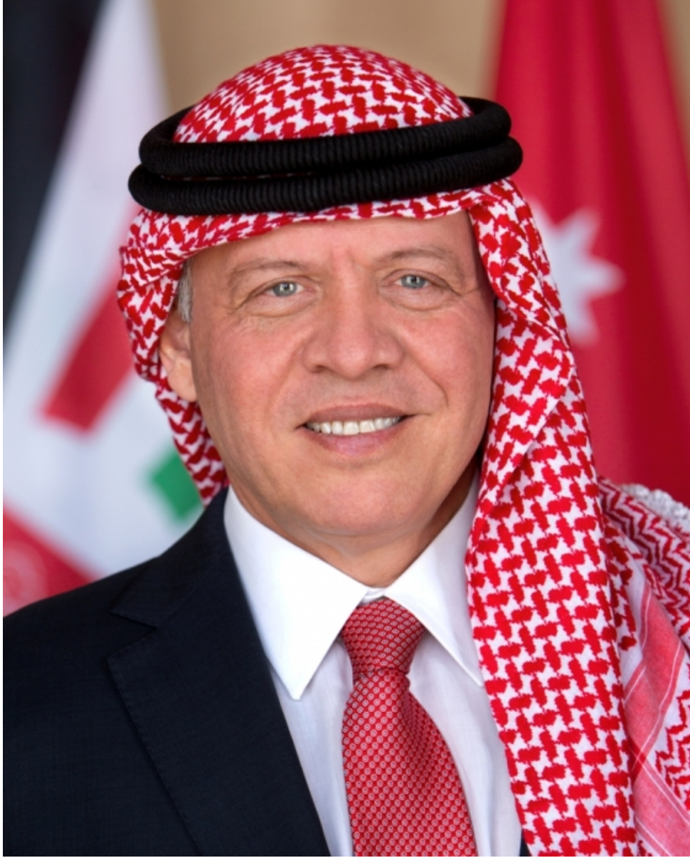
حضرة صاحب الجلالة الهاشمية الملك عبد الله الثاني ابن الحسين المعظم حفظه الله ورعاه